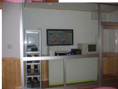
太陽エネルギーコーナー