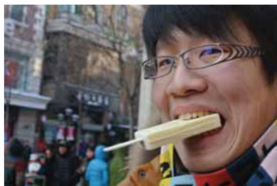
有名なアイスクリーム