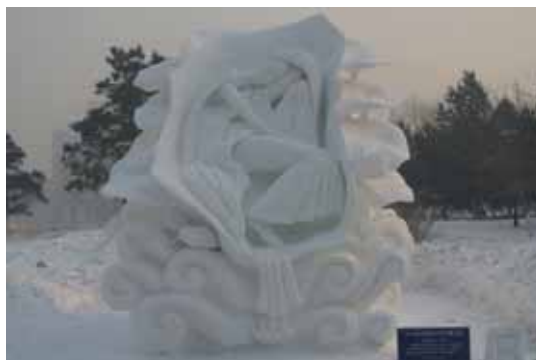
中国の大学の作品