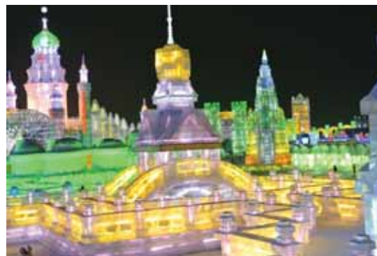
ハルビン冰雪祭り④