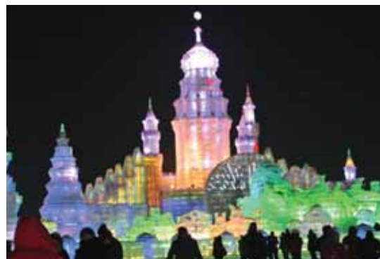
ハルビン冰雪祭り②