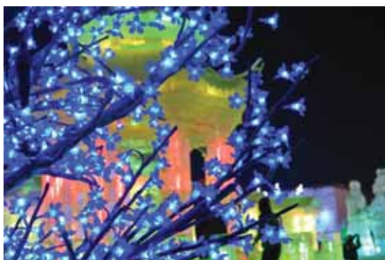
ハルビン冰雪祭り①