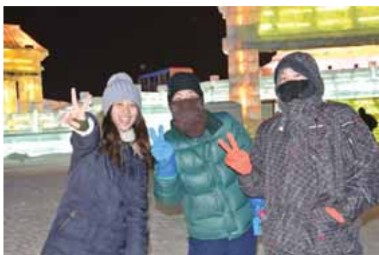
ハルビン冰雪祭り③