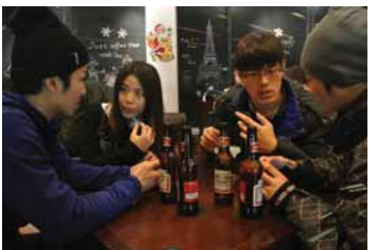
喫茶店でボランティア学生と会話