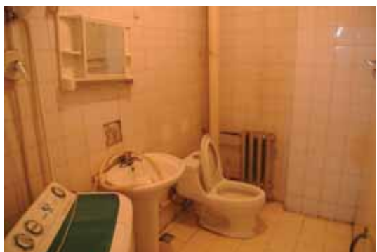
トイレとシャワー室