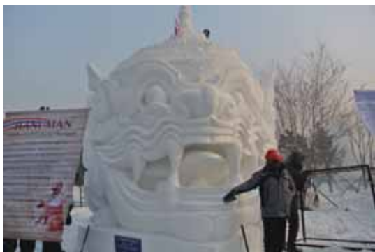
タイの大学の作品