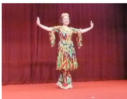
ボスタンさんによる ウイグルの伝統的なダンス