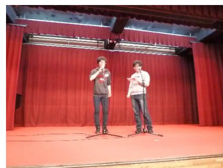
ジンさん、ナーさんによる 韓国の歌