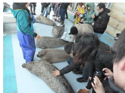
オホーツクとっかりセンター

留学生はシンポジウム参加や施設見学を通じてオホーツク海と流氷について学ぶだけでなく、実行委員の皆様やホームステイ家族の暖かい歓迎を受けながら、日本の文化や「おもてなしの心」について体験することができた。日頃勉学に追われ地域と交流することが少ない留学生にとって、本シンポジウムへの参加は地域の皆様と交流する貴重な機会にもなったようだ。ご招待に心より感謝を申し上げる。