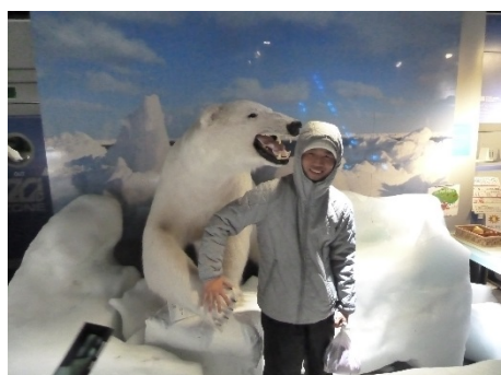
オホーツク流氷科学センター 「GIZA」