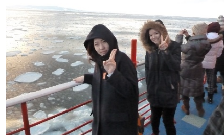
流氷砕氷船ガリンコ号II

2月21日(日)～22日(月)、紋別で行われた「第31回北方圏国際シンポジウム」に本学の留学生と教職員が招待を受けて参加した。北見工業大学からバスに乗って紋別に向かい、シンポジウムに参加し、交流会では韓国の歌とウイグルのダンスで自国の文化を紹介した。その後、各家庭でホームステイをさせてもらい、翌日は流氷砕氷船ガリンコ号IIから流氷を眺めたり、「オホーツクとっかりセンター」でアザラシに触ったり、北海道オホーツク流氷科学センター「GIZA」を訪問した。