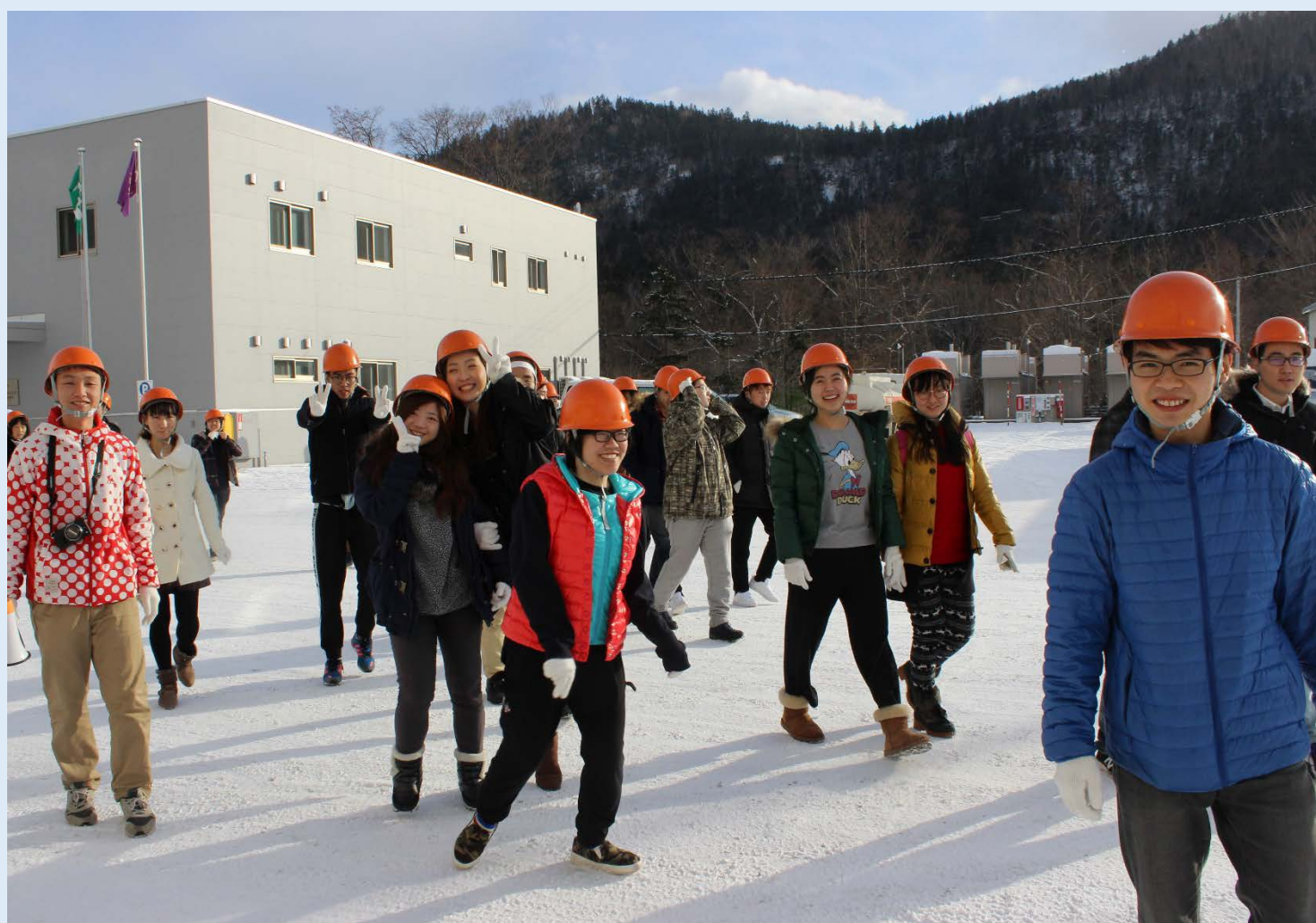
留学生工場見学会より：イトムカ鉱業所