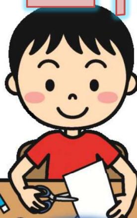
③自分だけの宝箱 (2組)