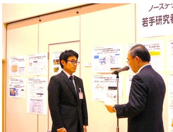
ノーステック財団 若手研究人材育成事業理事長賞