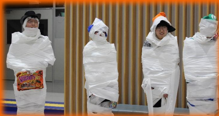
新留学生はミイラに変身！！