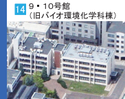
14 9・10号館 (旧バイオ環境化学科棟)