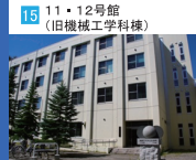
15 11・12号館 (旧機械工学科棟)