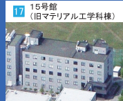
17 15号館 (旧マテリアル工学科棟)