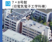
13 7号館 (旧電気電子工学科棟)