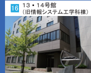
16 13・14号館 (旧情報システム工学科棟)