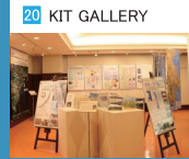
20 KIT GALLERY