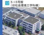
12 5・6号館 (旧社会環境工学科棟)