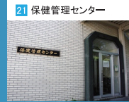
21 保健管理センター