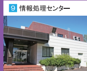
9 情報処理センター