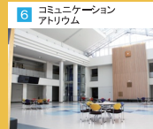
6 コミュニケーション アトリウム