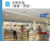
22 大学生協 (食堂・売店)