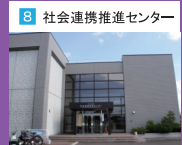
8 社会連携推進センター