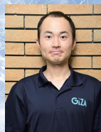
解説・展示協力 石原 宙 (オホーツク 流水科学センター)