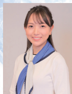
司会 舩川 弥生 (NHK北見放送局 キャスター)