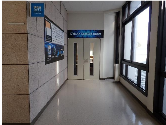
DYNAX Lecture Room の入口①