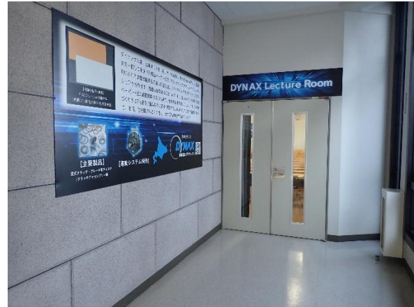
DYNAX Lecture Room の入口②